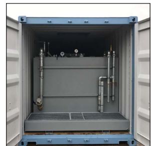
Spilltråg vid påfyllning