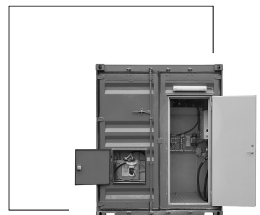
Lätt åtkomst till utrustningen