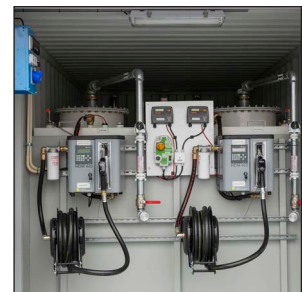
Pumpar med internt registreringssystem